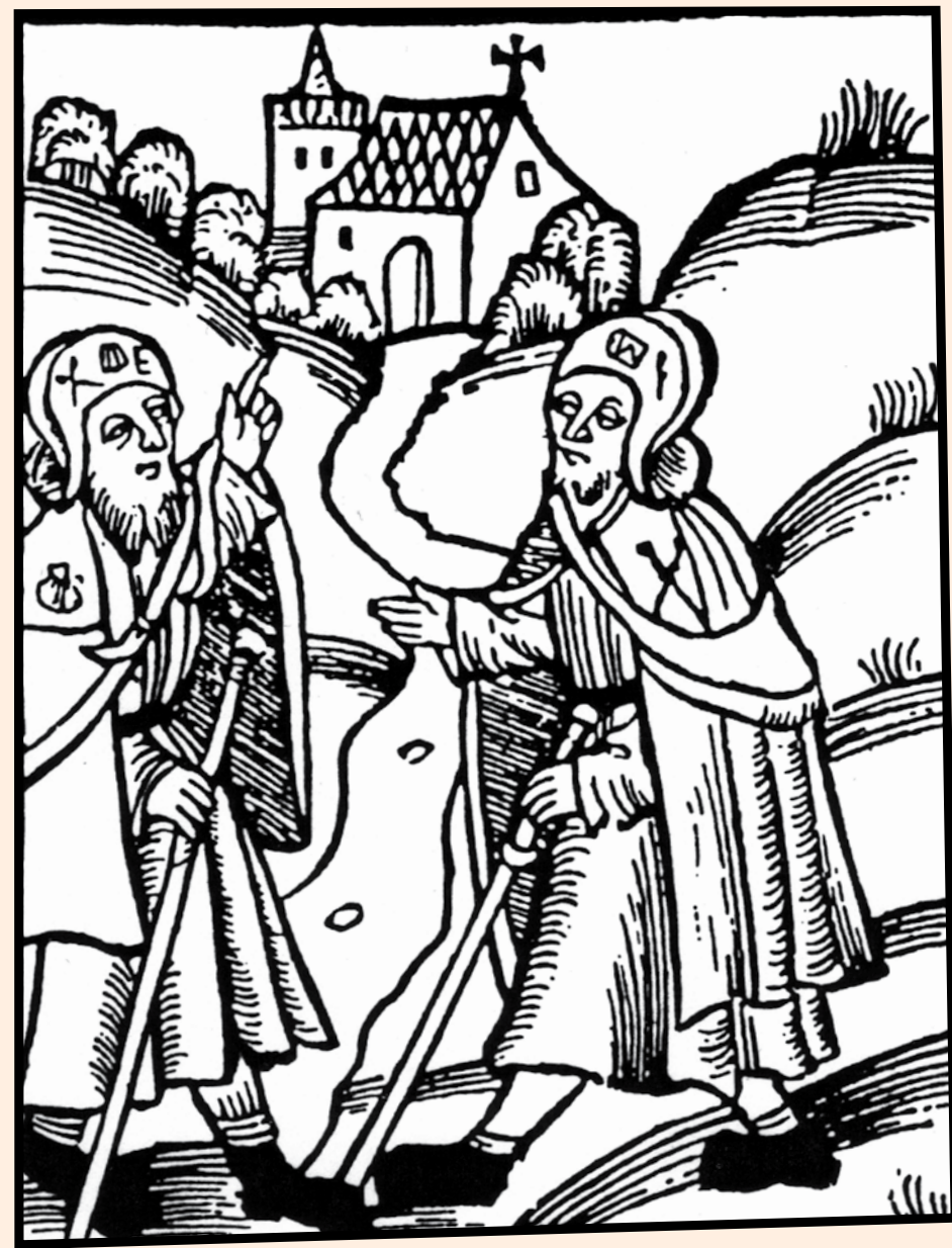
Aus dem Pilgerführer „Die Wallfahrt und Strass zu sankt Jakob“ des Hermann Künig von Vach (1494).