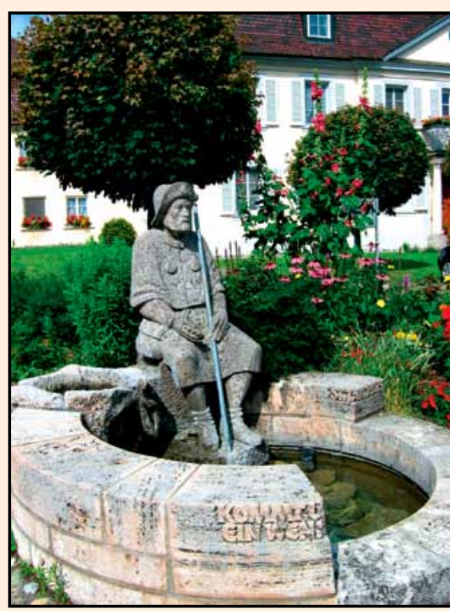
Pilgerbrunnen am „Cursillo-Haus“/Oberdisingen, Sitz der Schwäbischen Jakobusgesellschaft