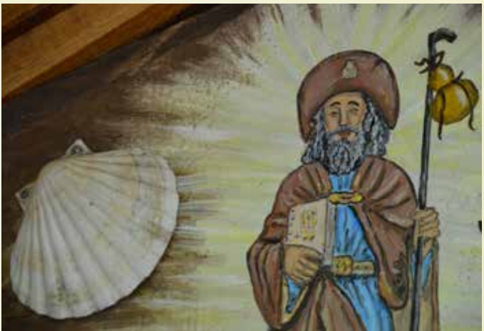
Jakobsschutzhütte an den Sieben-Quellen

Veranstalter / Anmeldung: Dekanat Heidenheim, Telefon 09833 275; dekanat.heidenheim@elkb.de; www.kloster-heidenheim.eu